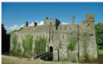
LE CHÂTEAU FORT DE PIROU

Fermé le 25 décembre et le 1 er janvier Closed on 25 th December and 1 st January